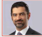
سعادة المهندس وائل بن ناصر المبارك وزيراً لشؤون البعثات والزراعة