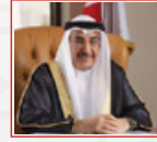
معالي الشيخ خالد بن عبدالله آل خليفة نائباً لرئيس مجلس الوزراء