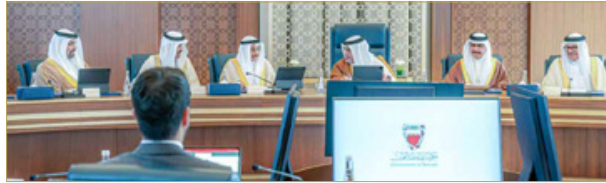
نائب جلالة الملك ولي العهد يترأس جلسة مجلس الوزراء

♦ التزام حكومي مخلص في تنفيذ التوجيهات الملكية السامية لتحقيق تطورات المواطن ... نائب جلالة الملك ولي العهد: