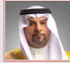
سعادة الدكتور محمد بن مبارك بن دينة وزيراً للطاقة والبيئة