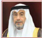
سعادة السيد غانم بن فضل البوعينين وزيراً لشؤون مجلسي الشورى والنواب