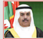
سعادة الفريق الركن عبدالله بن حسن النعيمي وزيراً لشؤون الدفاع